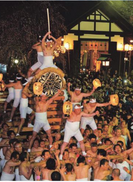
起し太鼓打ち出し場面 ※展示は太鼓のレプリカ