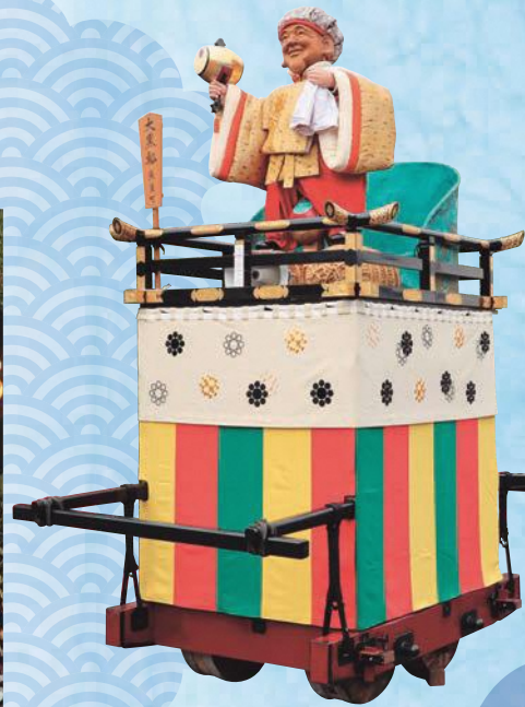
大垣祭 大黒軸 ※展示は模型